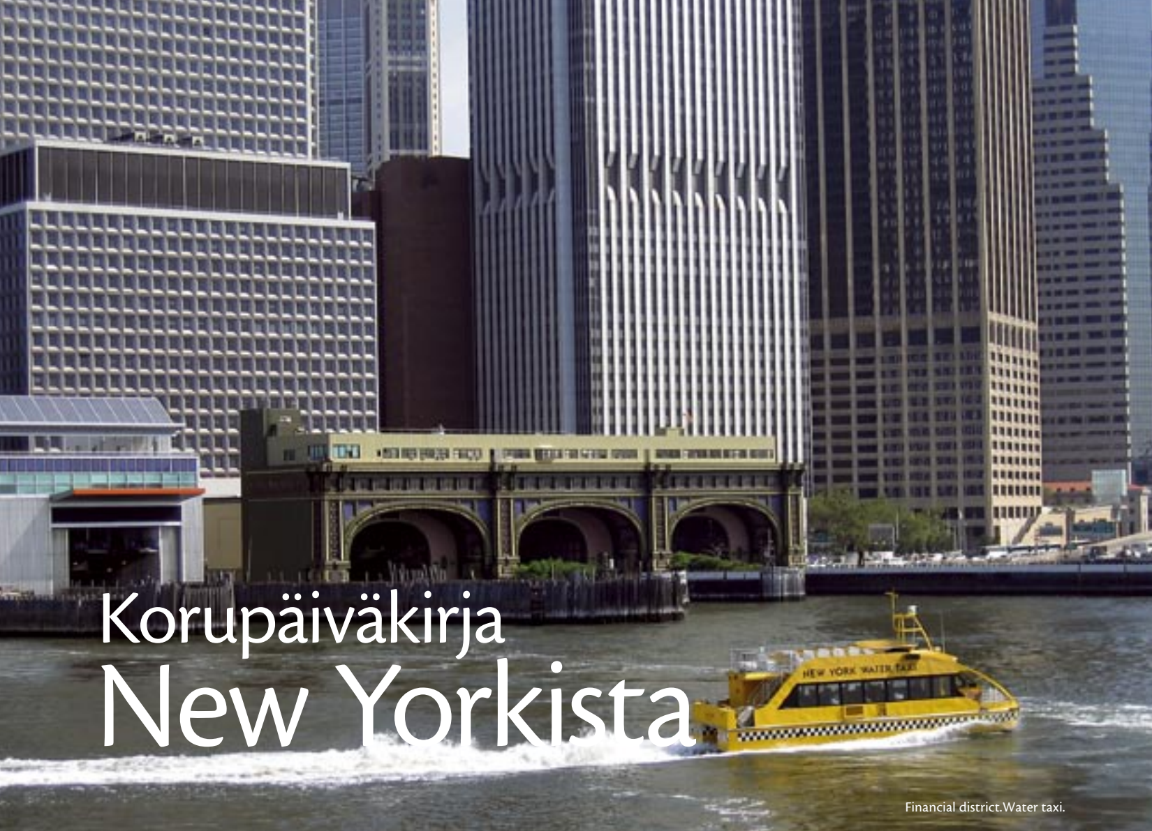
Financial district. Water taxi.