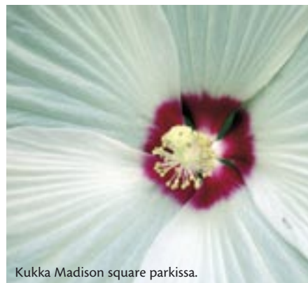
Kukka Madison square parkissa.